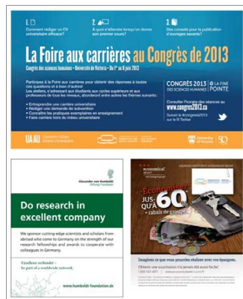
Exemple d'annonce : demi-page (disposition horizontale) et deux quarts de page (disposition verticale).