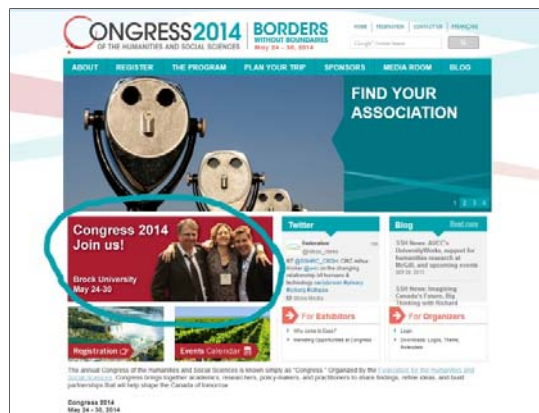
Annonce Web – Page d'accueil